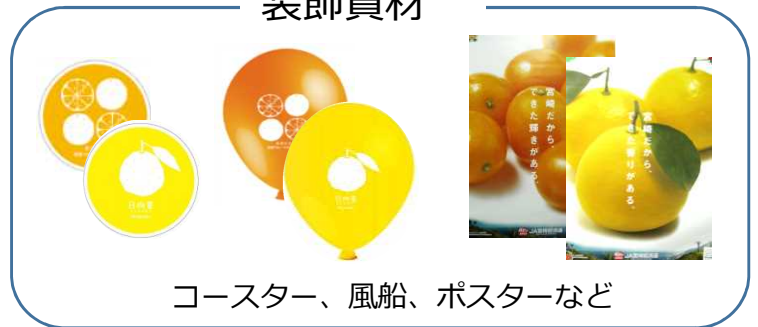
コースター、風船、ポスターなど