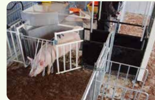
自動出荷選別機(オートソーター)

県内では、肥育豚の自動出荷選別機の導入が進んでいます。また、現在、体重計ではなく、画像解析を用いた選蓄機が研究されています。労力削減と枝肉単価の向上が期待されます。