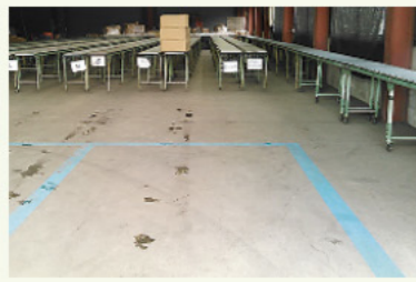
選果場に出荷物積み下ろし車両の停止線を設置