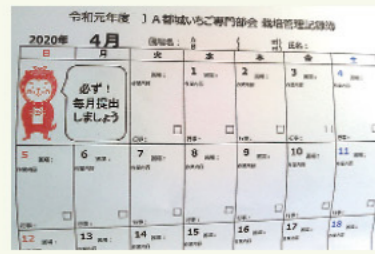
まとめて記帳できる部会オリジナルカレンダー