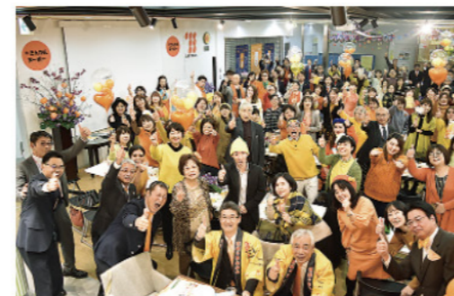
きんかんヌーボー(宮崎市)

令和2年1月14日の完熟きんかん「たまたま」解禁イベントとして、県内4地域、東京、福岡では、消費者と生産者が共に祝う「きんかんヌーボー」等が開催されました。海外では、副知事出席のもと台湾初のきんかんヌーボーが開催されるなど、きんかんヌーボーは海を越えて広がっています!