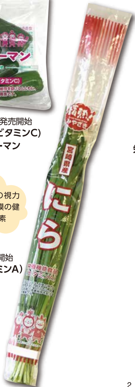
令和元年12月 発売開始 栄養機能食品(ビタミンA) にら