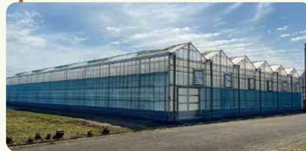
24aのフェンロー型ハウス (竣工落成式 令和2年3月26日)

10アールあたり目標収量 きゅうり (県平均)20t → 45t ピーマン (県平均)13t → 25t