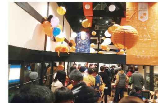
きんかんヌーボー(日南市)