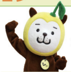
「日向夏発見200年」JPR大使 みやざき犬ひいくん