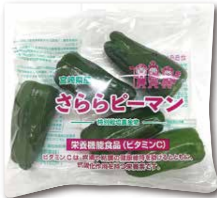
令和元年11月 発売開始 栄養機能食品(ビタミンC) さららピーマン