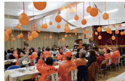
きんかんヌーボー(美郷町)