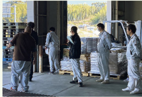
選果場審査の様子