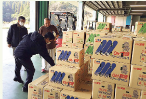
青果センター審査の様子