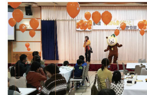
きんかん食べないと!(高千穂地区)