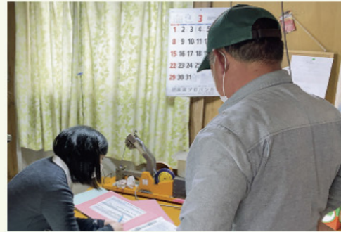
生産者作業場 審査の様子