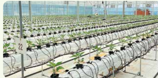
ピーマン定植(令和2年3月18日) きゅうり定植(同27日)