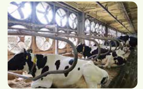
壁一面の給気・換気ファン

センサーにより、自動で温度、湿度、風速を均一に保つ次世代閉鎖型牛舎は、乳量・受胎率の向上、気流による害虫対策が期待されます。