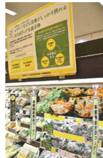
イオンスタイル宮崎店

「コーナー化されることで目に付きやすくなった。青果物の保健機能食品を積極的に買いたい」とお客様にも好評。今後も品目を増やし、消費者ニーズに合った売り場づくりをさらに展開していきます。