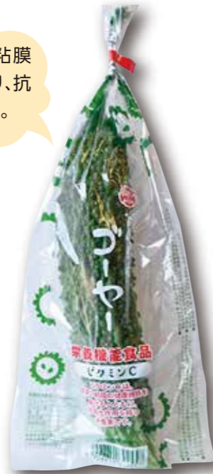
令和2年4月 発売開始 栄養機能食品(ビタミンC) ゴーヤー