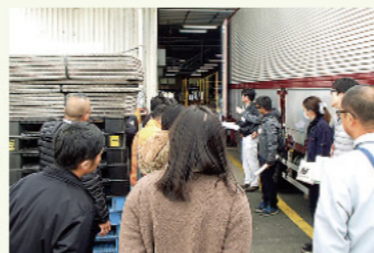
JAやつしろ選果場を視察