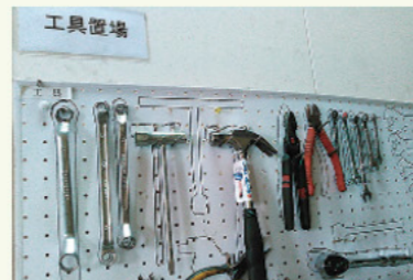
工具本数を一目で確認できる工夫