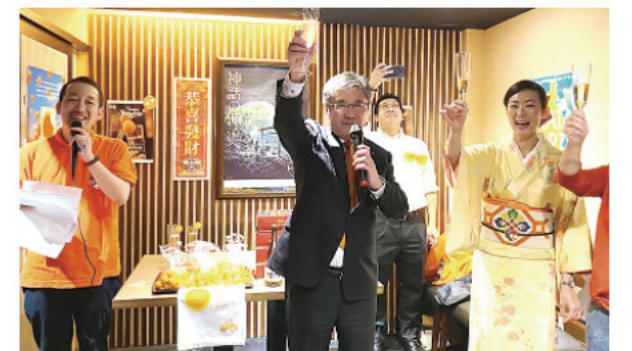
きんかんヌーボーin台湾(都司副知事)