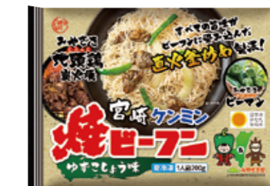
宮崎ケンミン焼ビーフン