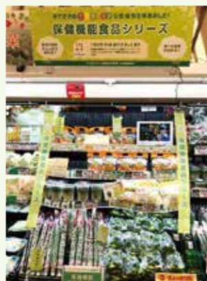
保健機能食品コーナーでの販売