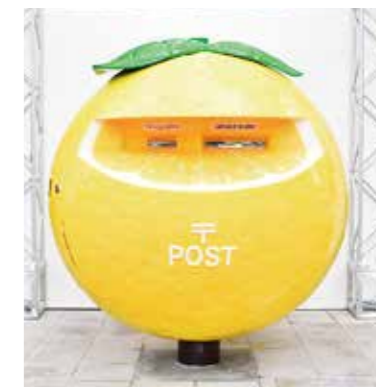
宮崎駅高千穂口前広場の日向夏ポスト

昨年11月にJR宮崎駅前広場に、商業施設「アミュプラザ」のオープンに合わせ「日向夏ポスト」を設置しました。日向夏発見200年を記念し、宮崎のソウルフルーツである日向夏をPRするもので、鮮やかな黄色が映えるポストです。この日向夏ポストから、大切な人へ想いを届けてみませんか。