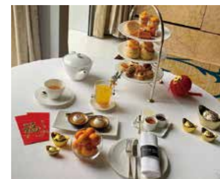
香港「宮崎キンカンアフタヌーンティー」