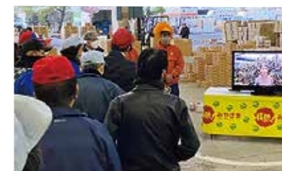
「たまたま」解禁日の市場での動画PR

香港の5つ星ホテル「フォーシーズンズホテル」では「宮崎キンカンアフタヌーンティー」が提供され、海外でも「たまたま」の魅力が広がっています。