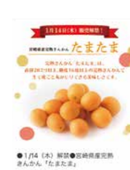
イオン九州アプリによる販売告知