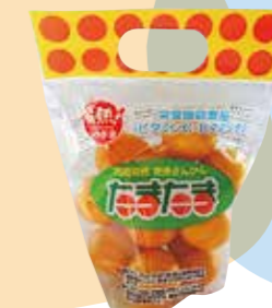
完熟きんかん「たまたま」 → ビタミンC, ビタミンE