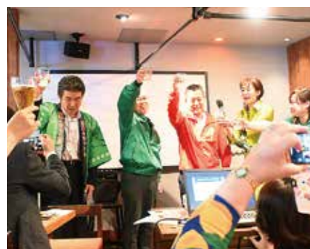
各品目の代表による乾杯