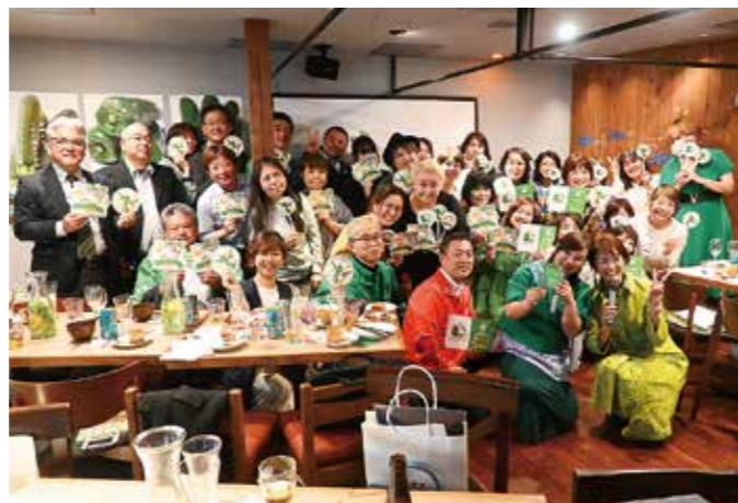
「推し野菜」をアピールしながらの記念撮影