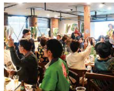
推し野菜投票の様子