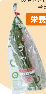
みやざきビタミンゴーヤー → ビタミンC