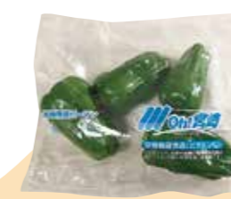
みやざきビタミンピーマン → ビタミンC

みやざきブランド推進本部では、平成17年度から農産物に含まれる栄養・機能性成分の分析に取り組んでいます。今回はブランド推進本部で商品化を手掛けた保健機能食品について紹介します。