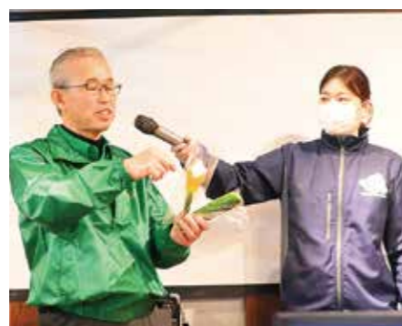
生産者による品目紹介