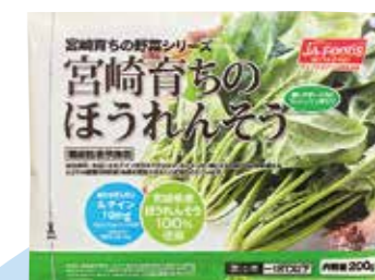
冷凍ほうれんそう → ルテイン