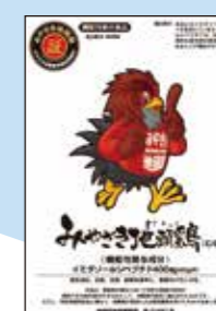
みやざき地頭鶏 → イミダゾールジペプチド