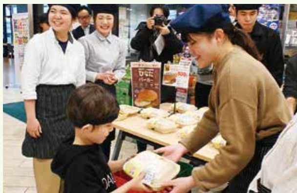
3月15日の売場の様子

宮崎大学の学生は、「宮崎ブランドポーク」を活用したレシピ開発に取り組んでいます。令和6年度には、宮崎ブランドポーク100%のパティと日向夏ソースを使用した「ひなたバーガー」を開発。エーコープみやざきの惣菜部門と試食会や提案会を重ね、令和7年3月15日に販売会を実施しました。「ひなたバーガー」200個は、およそ5分で完売！学生からも喜びと驚きの声がありました。